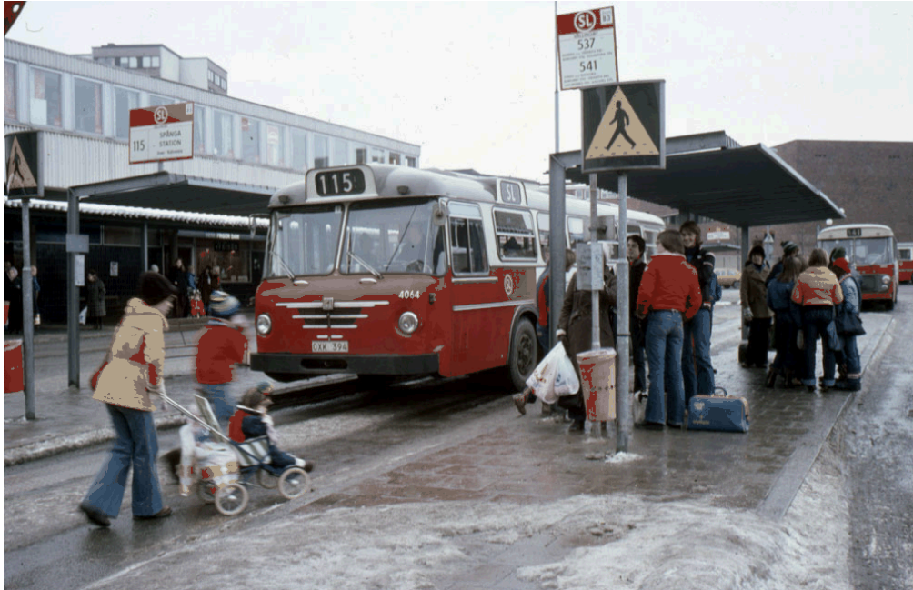
Bilden visar bussplanen 1977

Med tanke på att det är många oskyddade trafikanter som rör sig på bussplan när de ska resa med buss och tunnelbana till och från Vällingby vill vi förebygga eventuella trafikolyckor. Därför gäller nya trafikregler för bussplan från och med måndagen den 3 september 2012.